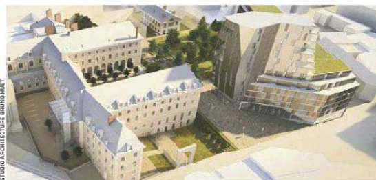
Couvent, prison et tribunal seront transformés en un ensemble dense mais désenclavé.